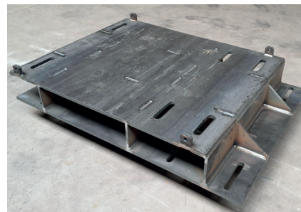
Chaise moteur 900kW