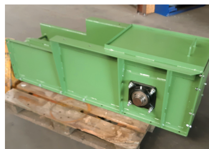
Pièce de convoyage et placement des pièces mécaniques comme un palier