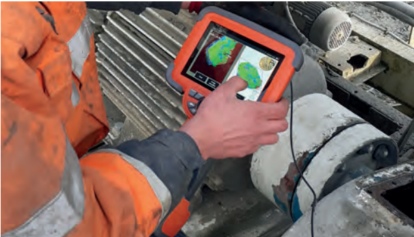
Endoscopische analyse on site