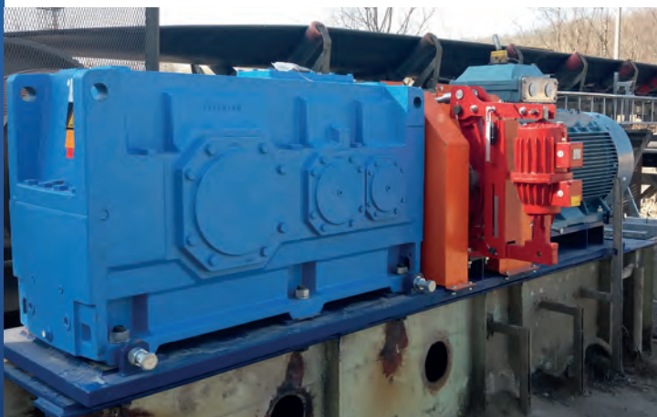
Levering van tandwielkast, motor, koppeling, rem en onderstel, voormonteerd