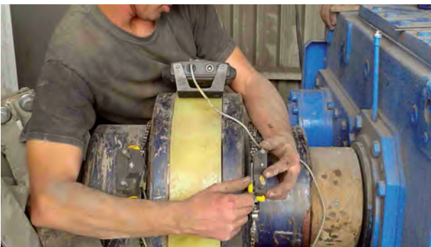
Laser uitlijning van een industriële tandwielkast